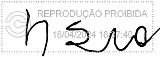
HSIA SAO WAH 18 abr 2024, 16-37-41.png

Assinatura manuscrita com hash SHA256 prefixo 94d98d(...)